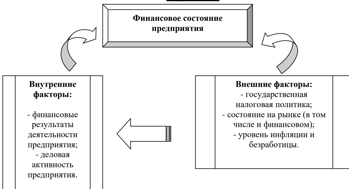
Рисунок 1 - Факторы, воздействующие на финансовое состояние предприятия

6.16 При ссылке на Таблицу, Рисунок, Диаграмму следует указать их номера и страницу, на которой они расположены. Разрывать таблицу и переносить часть ее на другую страницу можно только в том случае, если она целиком не уместается на одной странице. При этом на другую страницу переносится и шапка таблицы, а также заголовок «Продолжение таблицы». Рисунки и Диаграммы переносить не рекомендуется. Все рисунки, схемы, диаграммы в ВКР называются рисунками.